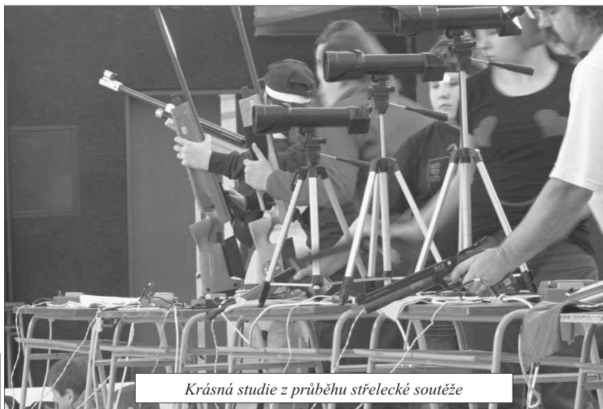
Krásná studie z průběhu střelecké soutěže