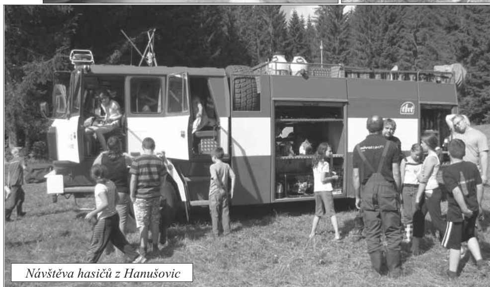
Návštěva hasičů z Hanušovic