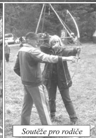
Soutěže pro rodiče