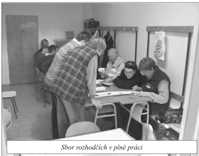
Sbor rozhodčích v plné práci