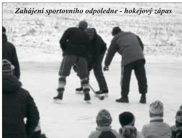
Zahájení sportovního odpoledne - hokejový zápas