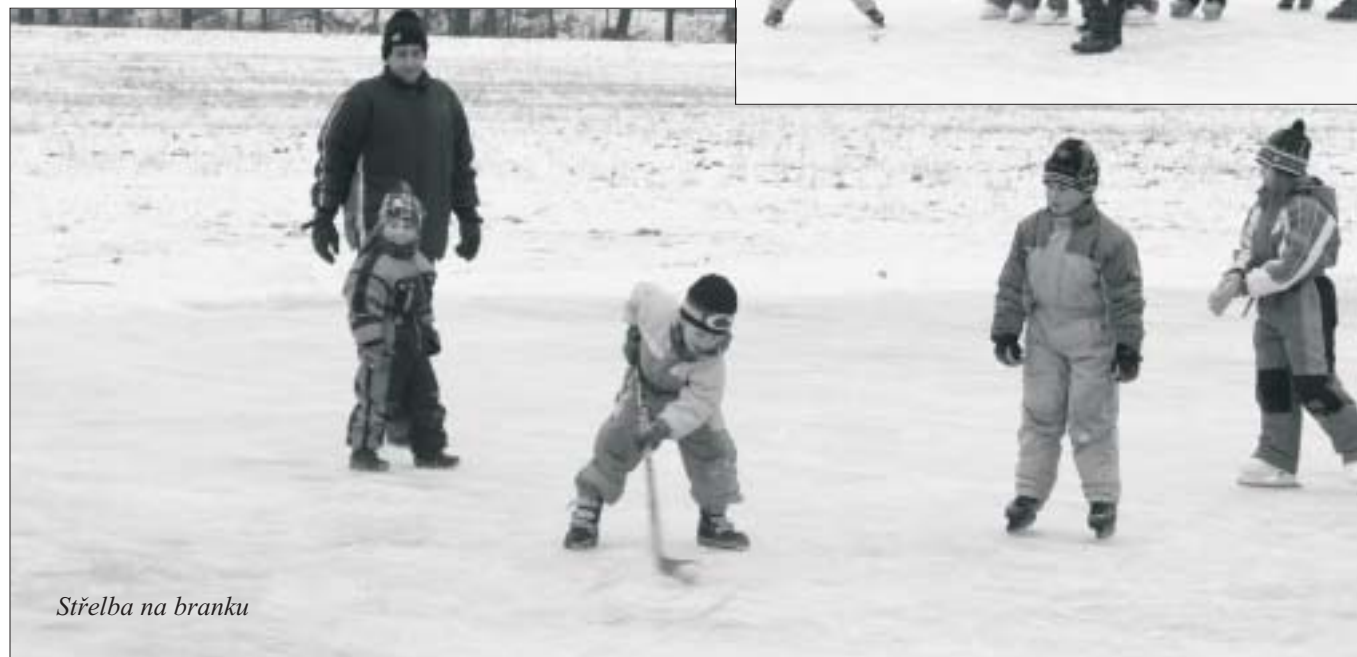
Střelba na branku