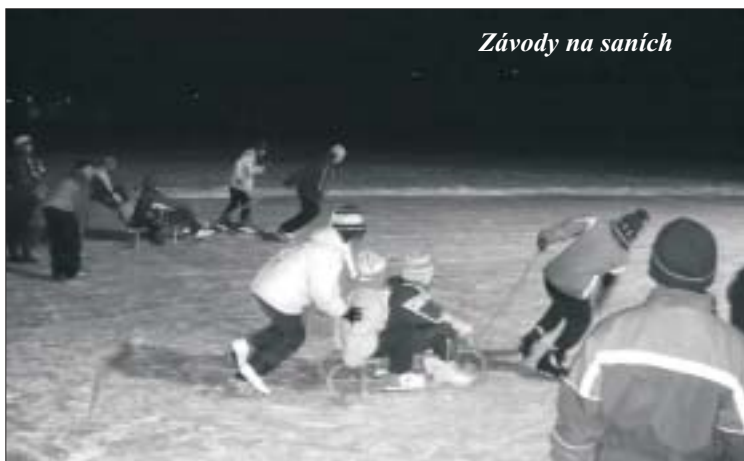
Závody na saních