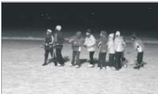
Přetahování na laně