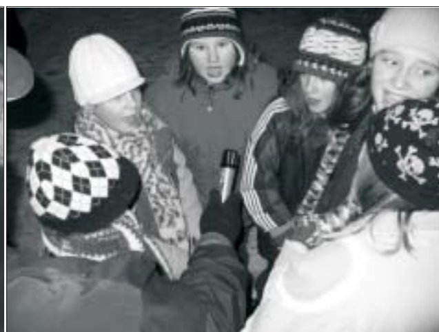
Soutěž ve zpěvu