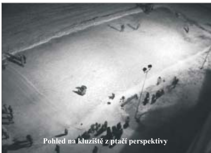
Pohled na kluziště z ptačí perspektivy