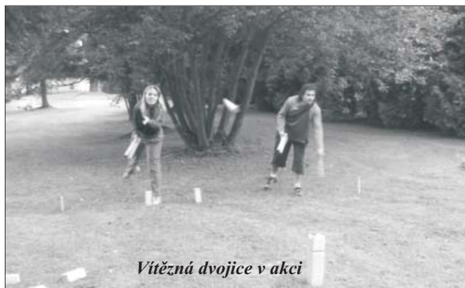
Vítězná dvojice v akci