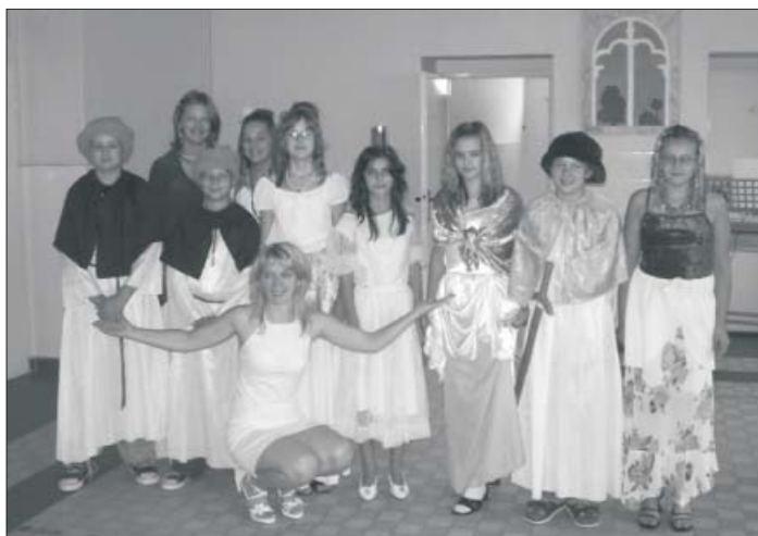
Královská družina v celé sestavě →