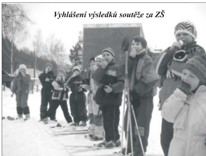
Vyhlášení výsledků soutěže za ZŠ