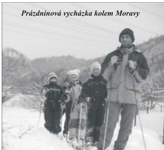
Prázdninová vycházka kolem Moravy