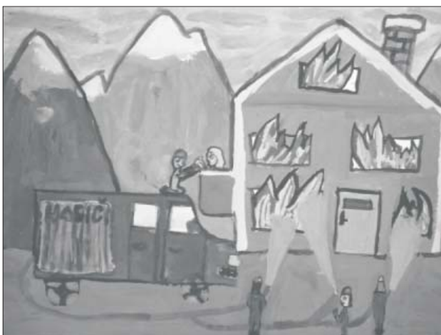
Nakreslila A. Bugnova