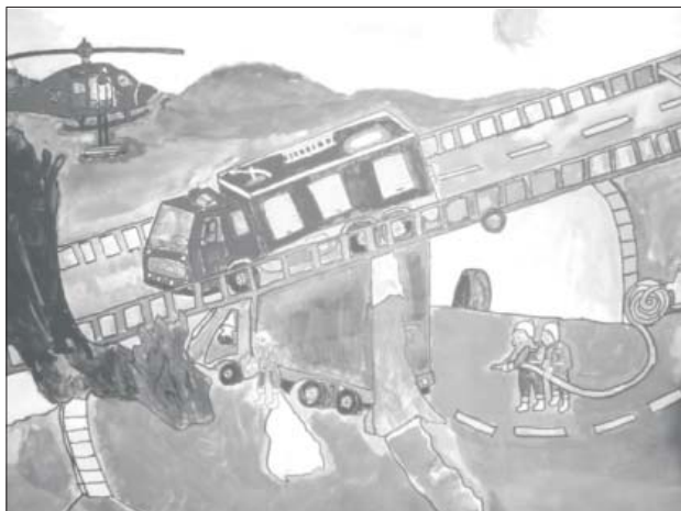
Nakreslil O. Ceh

Ceny za nejlepší práce věnovaly pořadatelé, tj. Město a hasiči Hanušovice. -af