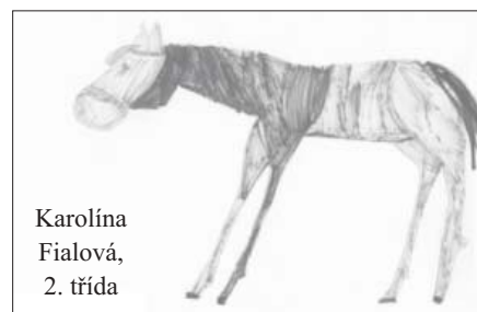
Karolína Fialová, 2. třída