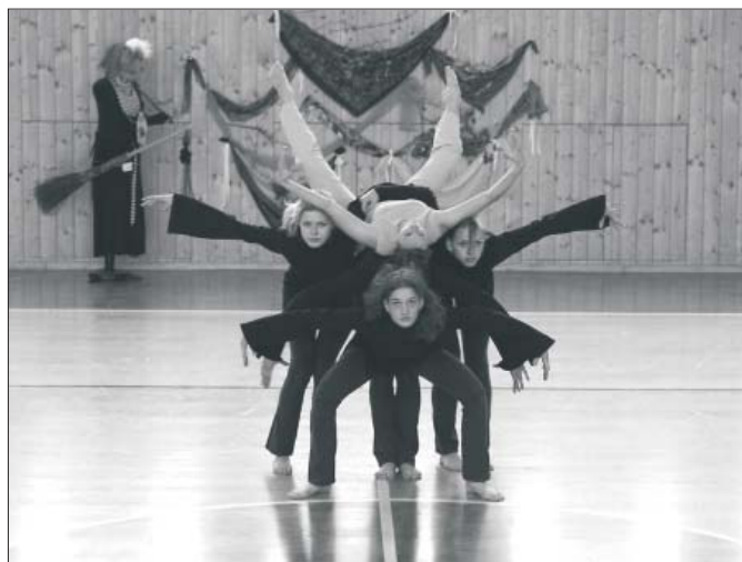
Fotografie z krajské přehlídky v Šumperku