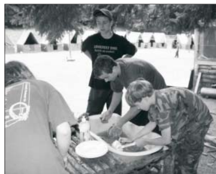
služba v kuchyni plní své povinnosti