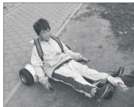
projížďka na vozíčkách na Ramzové