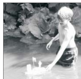
soutěžní přehlídka lodiček