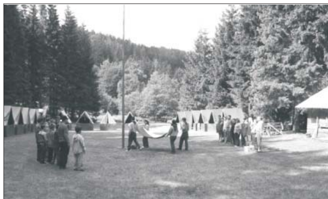
Vlajka vzhůru letí – zahájení tábora