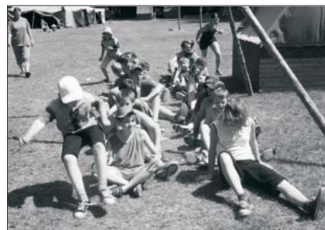
mezioddílové soutěže – táborová olympiáda