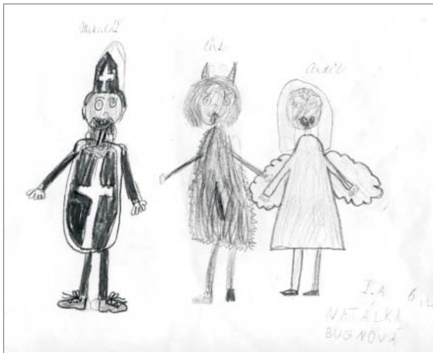
Hodně dětí, těšte se! Nadílku vám donese. Obrázek malovala Natálka Bugnová 1. A