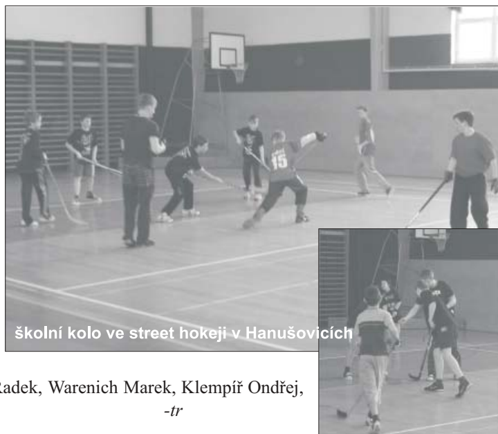
školní kolo ve street hokeji v Hanušovicích

Po úspěšném a vydařeném školním kole ve street hokeji (výsledky v minulém čísle Hanušovických novin) pokračovali naši nejlepší hokejisté v dalším kole. Tentokrát museli naši kluci přejít přes kolo oblastní a jejich soupeřem byla sousední škola z Raškova. Hrál se na dva zápasy a oba jsme dovedli zdárně do vítězného konce. První zápas skončil v poměru 11:0 a druhý 19:0. Postoupili jsme tedy do kola krajského, kde nám byla vylosována škola ze Štítů. Jestliže přejdeme úspěšně i přes školu ze Štítů, můžeme se 26. dubna těšit na velké finále 64 nejlepších škol z moravskoslezského kraje, které se koná v Ostravě v hale Sereza za účasti televizních kamer a radiostanic.