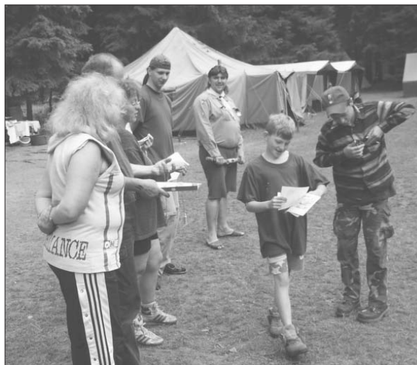
Předávání diplomů nejlepším borcům