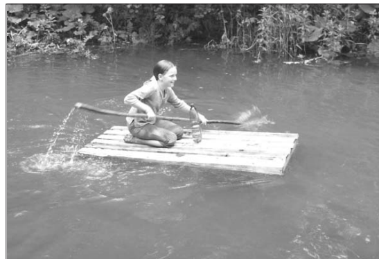
Hurá domů s ukořistěnou vodou