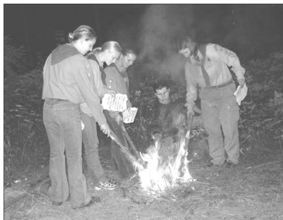
Slavnostní zapálení táborového ohně