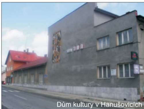
Dům kultury v Hanušovicích

Na závěr několik statistických čísel: od roku 1995 se odehrálo 1011 představení, které navštívilo 51 536 diváků.