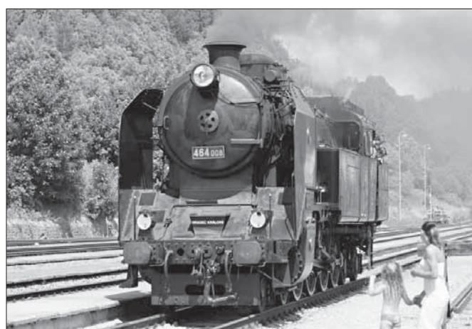
foto 1: 464.0 - zvaná Bulík nebo Ušatá foto 2: 423.0 - Velký bejček foto 3: M 850.0 - Hydra nebo Krokodýl

Na fotografiích ze železniční stanice Hanušovice jsou zachyceny všechny uvedené stroje.