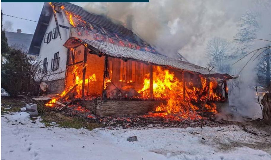
► Požár chaty likvidovalo několik hasičských jednotek.